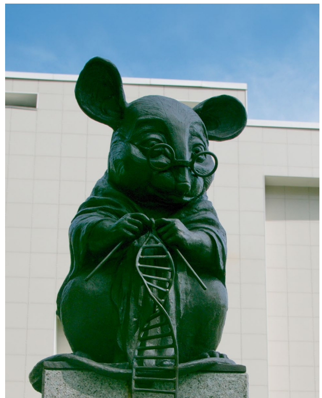
Whakamaharatanga ki ngā kararehe taiwhanga pūtaiao.

Nā runga i te piki haere o te māharahara ki tā te tangata tiaki i ngā kararehe, inarā, te tiaki i ngā kararehe i ngā whenua e kaha nei te ahumahi, i hua ai te pekanga o te matatika kararehe, e tūhono nei i te pūtaiao me te tautake. E rua ngā ara matua o ngā ariā e hāngai ana ki ngā matatika kararehe, arā, ko te ara o te whakakotahi me te ara o te tūhonohono, e rehurehu nei ngā roherohenga i waenganui i ngā mea e rua.