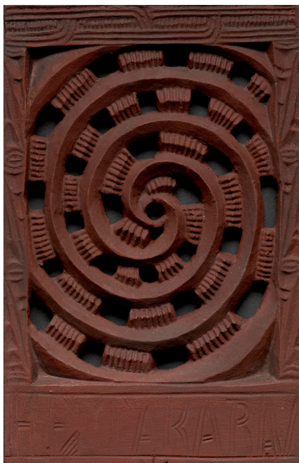
Tauira (‘He Takarangi’ te ingoa o te tauira whakairo nei) i tāngia ai e Anaha Te Rahui i Rotorua, i te tau 1909. He mea pūpuri nā Te Papa (ME024168/8)