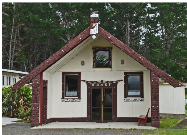
Auahi Kore marae.

Ko tētahi o ngā tauira matua o te whakaaro Māori ko te whakapapa. Kei runga i te whakapapa ko ngā huatau mātāmua, ko te tapu me te mana. Kei te pae tuatoru, ko te takitoru o ngā uara Māori, ko te pono, ko te tika, ko te aroha hoki. Ka whakatakina ēnei huatau ki raro iho nei.