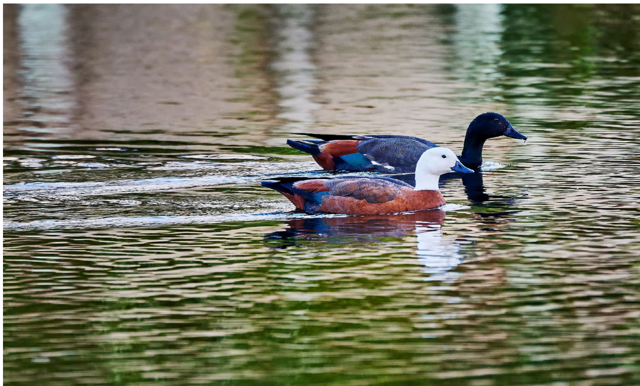
Te pūtakitaki/pūtangitangi.

i whakapau kaha a Te Winiwini Kingi ki te tiaki i ngā toenga puihi i ngā pākau o ōna whenua, nā runga i tana whakanau i te whai moni mā te tuku i ngā kau ki te kai i runga i aua whenua, nā te mea i mōhio ia ka whakakinotia te hauropi māori o te ngahere i toe mai. Nā runga i te hāngai ki ngā huatau o te torowhārahi me te tūhonohono, e iti iho ana te tūponotanga ka whakamātāmua ngā matatika Māori i te tangata, e kitea ai ko ngā tāngata anake ka whai mōtika, kua ko ngā kararehe. Ina whakaarohia te katoa, ka puta i te pono, i te tika me te aroha te whakaute me te mōhio ki te haepapa o te motuhenga i te ao tūroa, e noho nei ngā kararehe me ngā tāngata.